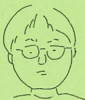
木首山奇 キャッシュレガー保守担当 一児のパパは張り切ってます。