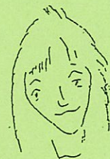
川崎 キャッシュレガーインストラクター 一見冷静にみえて実は…