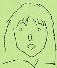
粟村 キャッシュレガー契約担当 キャリアウマンをめざす しっかり者です。