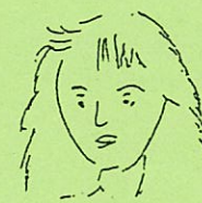
原原 広報担当 つちや通信で奮闘中!