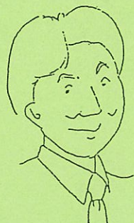
香川 キャッシュレガーならおまかせ、 若手のホープは頑張ってます。